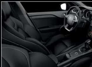
Fekete Claudia bőr