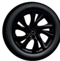
17'' CANBERRA fényes fekete [1] [2]