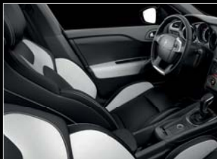
Fekete Claudia/fehér nappa bőr