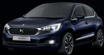
Indigókék (1) (M)