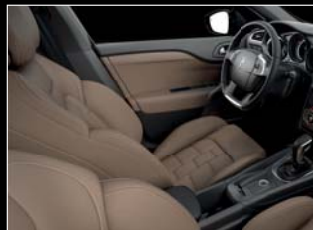
Habana félanilin bőr (integrál változatban is elérhető)