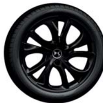
18'' BRISBANE fényes fekete [1] [2]