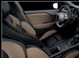
Fekete Claudia/Habana nappa bőr