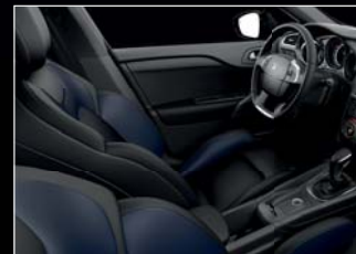
Fekete Claudia/zafírkék nappa bőr