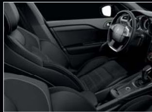
Dinamica bőr/szövet (sötét)