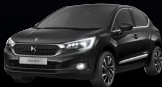
Perla Nera fekete (M)