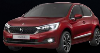
Rubintvörös (1)(2) (M)