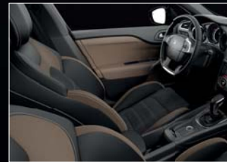
Dinamica bőr/szövet (Habana)