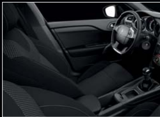
Lacina és Omni Repts szövét