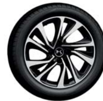
17'' CANBERRA gyémántfényű és fekete [3]